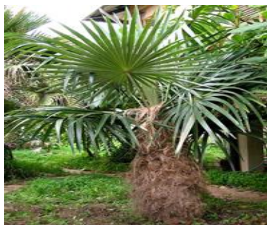
Monumento Nacional. La Palma

Se construyó en el poblado de Las Pozas, en el año 1952, en honor a la batalla de Cacarajícara. Está construido sobre una base pentagonal de mármol negro, colocada sobre una estructura escalonada de piedra de la cual al centro, sobresale una figura de una mujer esculpida en mármol blanco, escoltadas por dos pirámides que terminan en cúspide de bronce. Actualmente sólo una columna posee pirámide. Este obelisco se encuentra en buen estado. Tiene valor histórico.