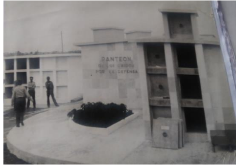
Panteón de los caídos por la defensa.

Se ubica en la esquina 21 y 32 en el parque José Martí. La efigie del Mayor General Pedro Díaz Molina, es un tallado en bronce que al estar a la intemperie, ha perdido su color natural. Después de ser remozado, el busto mantiene su estructura original. Su estado actual es bueno y tiene valor histórico.