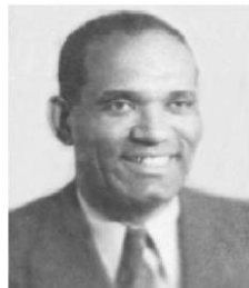
Rafael López González. Compositor de la Sitiera (1907-).

Escritor nacido el 28 de octubre de 1812, en el ingenio Santiago, en San Diego de Núñez. En su infancia presencié con horror, las duras faenas a que eran sometidos los esclavos. Estudió leyes y se destacó como una figura indiscutible de las letras cubanas, las ciencias, el magisterio y el periodismo. Dentro de su obra literaria, sobresalen la novela Cecilia Valdés o La Loma del Ángel, Excursión a Vuelta Abajo y El Diario del Rancheador, donde deja la impronta de su cubanía. Después de casi 50 años de exilio, en 1894, muere en Nueva York.