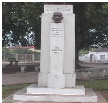
Busto del Mayor General Pedro Díaz Molina.

Se localiza en el parque de Las Madres, en la Ave 23. La estatua se asienta sobre una base escalonada de cemento rústico y bloques en forma de pirámide. Su construcción data de 1939 en homenaje a las madres bahiahondenses. Fue mandada a construir por el senador de la república, José Manuel Casanova Diviñó dueño del ingenio Orozco. Su estado actual es bueno y tiene valor ambiental.