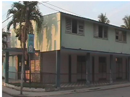
Casa de Cultura Cirilo Villaverde de la Paz.

Lugar donde reposan los restos de los héroes y mártires caídos por la defensa de nuestra patria. Este se encuentra ubicado en el cementerio de Bahía Honda y su estado actual es bueno.