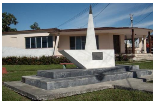
Parroquial de San José de Honda.

Se encuentra ubicada en Su construcción se inició