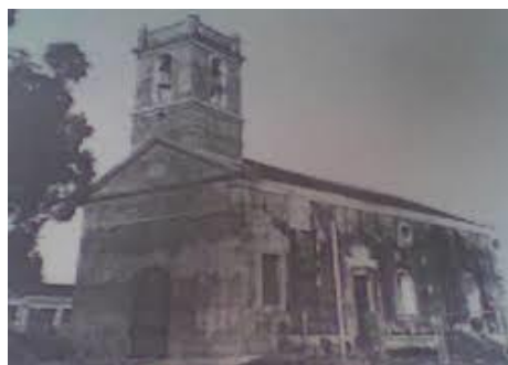
Iglesia la Montaña en Bahía

Antiguo Liceo de Blancos. Actualmente Casa de Cultura. Su estado actual es bueno y tiene valor histórico y cultural.