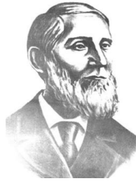
Cirilo Villaverde de la Paz (1812-1894).