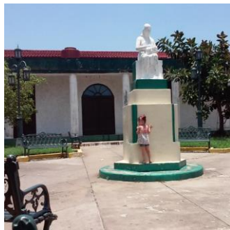
Estatua de Las Madres.