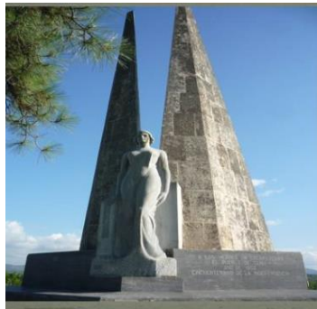
Obelisco erigido en homenaje al combate de Cacarajícara.

Se encuentra ubicado en la Ave 21, esquina calle 26. Se construyó en honor a los mártires bahiahondenses caídos en las luchas por la independencia de Cuba. Data del siglo XX, su estado actual es bueno y tiene valor histórico. Su construcción es de ladrillos, cemento gris y losas. Termina en una pirámide con un casquillo en la punta que fue utilizado en el obelisco a la Batalla de Cacarajícara.