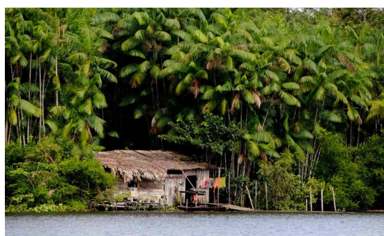
Figura 03- Demonstração de Plantação Familiar de Açaí.

O presente trabalho utilizou dados da estrutura produtiva da cultura do açaí no estado do Amazonas e efetuou avaliação técnica da implantação/exploração de 1(um) hectare (ha), com orçamento para a espécie considerada neste estudo, Euterpe oleracea Mart., com as medidas técnicas de espaçamento 5,0 m x 4,0 m (20m 2 ) com aproximadamente 500 plantas/ha, cada uma produzindo em média 20 kg de frutos/ano. Os resultados foram separados por unidades produtivas e seguem abaixo. A análise dos fluxos de caixa do projeto foi submetida a uma taxa de 10% a.a para a unidade.