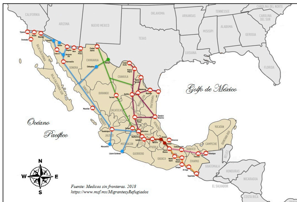
Figura 3. Albergues y casas de migrantes en México.