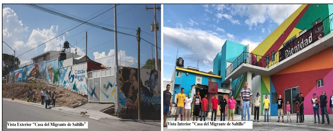
Figura 4. Vista exterior e interior de la CMS.

Los voluntarios y administrativos de la Casa organizan agendas con diversas actividades orientadas a aspectos: humanitarios (descanso, comida y ropa), asistenciales (todo lo relacionado con el ejercicio de sus derechos humanos, asistencia jurídica y migratoria) y desarrollo personal (esparcimiento, atención mental-espiritual) a través de las siguientes actividades: sesiones de inducción al idioma inglés, sesiones de yoga, ejercicio físico, corte de pelo, arteterapia (dibujo, pintura, etc.), música, lectura, proyección de películas y televisión, servicios religiosos (misa, reflexiones, oración, etc.), convivencia con grupos sociales (estudiantiles y de la sociedad civil) que acuden a hacer servicio comunitario a la Casa.