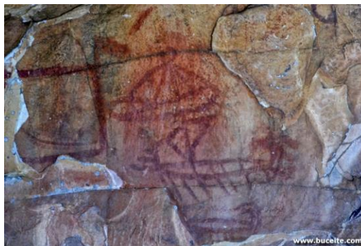
Ilustración 1. Pintura Rupéstre esquemática de una embarcación.

Un caso que merece mención son las representaciones rupestres de embarcaciones prehistóricas del abrigo de Laja Alta (Jimena de la Frontera, Cádiz). Las pinturas han sido motivo de numerosos estudios y sus interpretaciones han sido de lo más variadas: su estudio comenzó a finales de los años 70 del s. XX pero fue en el año 1980 cuando C. Barroso realizó un análisis detallado (Barroso, 1980: 133) 5 . En su estudio se describían embarcaciones de distintos tipos y elementos: