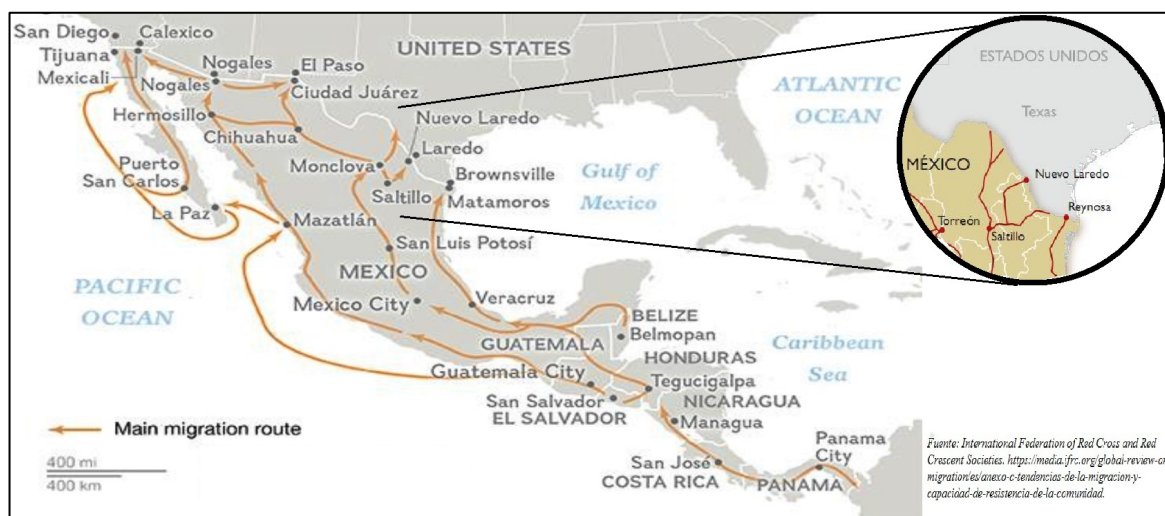
Figura 2. Ubicación de Saltillo, Coahuila dentro de las rutas terrestres de migración por México.

Saltillo ocupa el 3.7% de la superficie del estado de Coahuila y cuenta con 668 localidades (Instituto Nacional de Geografía y Estadística, s.f.). La ciudad dispone de ejes carreteros importantes que la comunican con las principales ciudades del país y de la frontera estadounidense; además de la red ferroviaria que se estableció desde 1892 y que se expandió y fortaleció a principios de 1970 (México Desconocido, s.f.) y se ha constituido en el medio de transporte más habitual para el traslado de migrantes que buscan llegar a los Estados Unidos. (Figura 2)