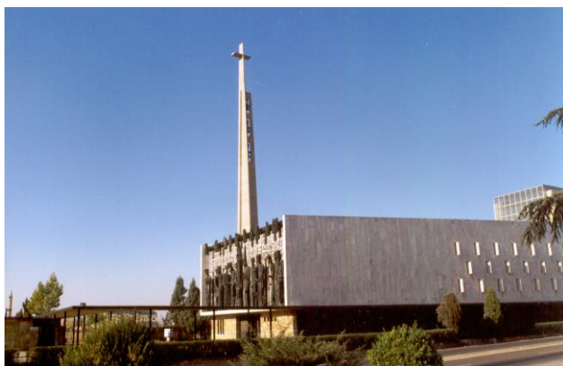
Ilustración 6.. Nuevo Santuario La Virgen del Camino.