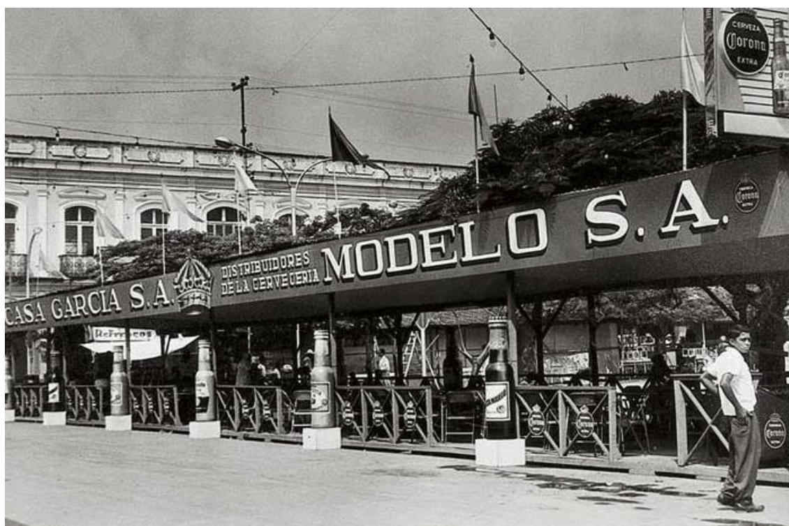
Ilustración 4. Grupo Modelo.