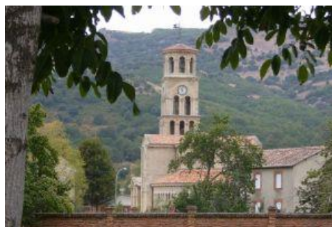
Ilustración 5. Iglesia de Vegaquemada.

S.A., Nueva Fábrica Nacional de Vidrio S.A., Fábrica Nacional de Malta S.A. etc.