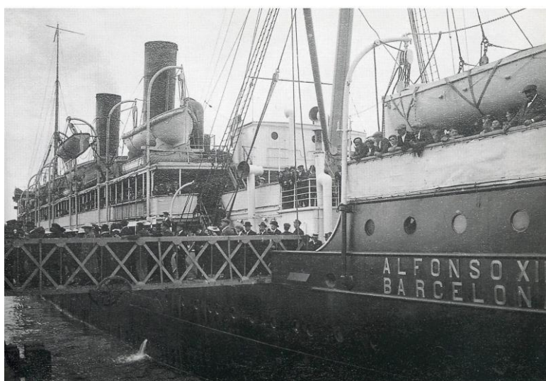
Ilustración 3. Vaporero Alfonso XIII. Tipología de barcos transoceánicos durante esta etapa.

Las dificultades del lugar empujaron a este hombre a viajar hasta México en 1905. La emigración española transoceánica hasta el siglo XIX no era muy abundante, la legislación existente era sumamente restrictiva y los controles que se establecían (historial de antecedentes, permisos de embarque etc.) eran