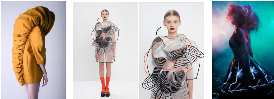
Fig.4 Chimaera, Leyre Valiente,2011 Fig.5 Noa Raviv,“Hard Copy” 2014 Fig.6 Rainbow Winters, Amy

Pilar Dalbat haciendo uso de nuestra realidad más tecnológica, muestra en 2017 en el Off de la Mercedes Benz Fashion Week de Madrid un avance de su colección para 2018 con un desfile en realidad virtual, donde los espectadores interactúan con las obras y el espacio. La visualización de la prenda es de 360° y con una localización espacial variada.