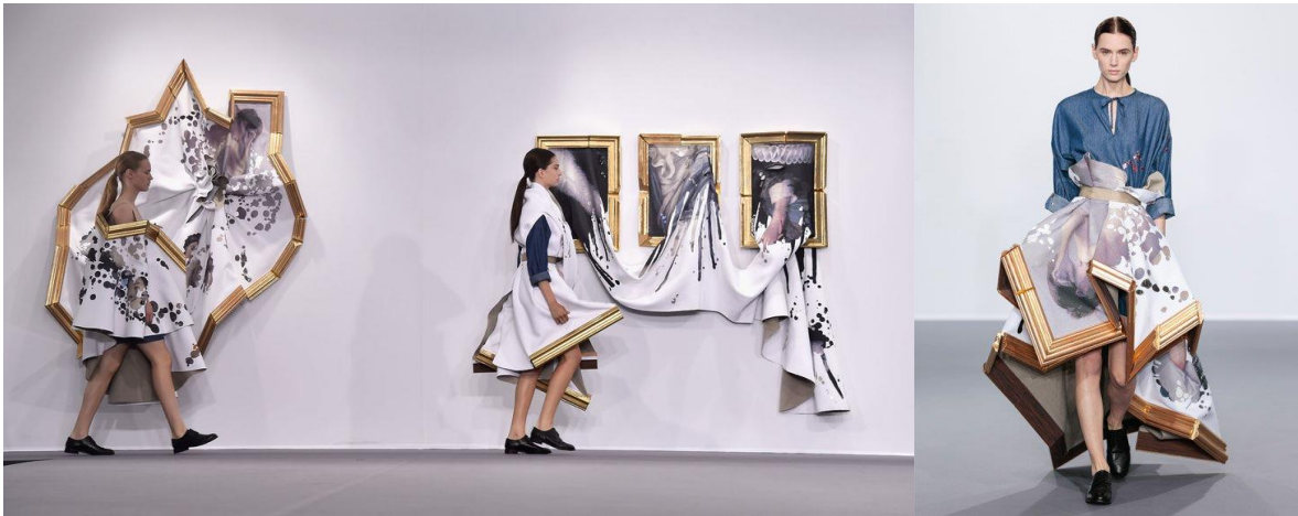
Fig. 1. Wearable art Collection , Viktor and Rolf, 2015

Tal vez la diferencia esencial sea que el fenómeno que Barthes señala es ahora universal. Con un complejo lenguaje de “cuerpo revestido”, la moda interacciona con otras artes como la fotografía, música, publicidad... en una época de consumo de masas dominada por las pantallas, la tecnología e “iconofilia” de una cultura visual globalizada.