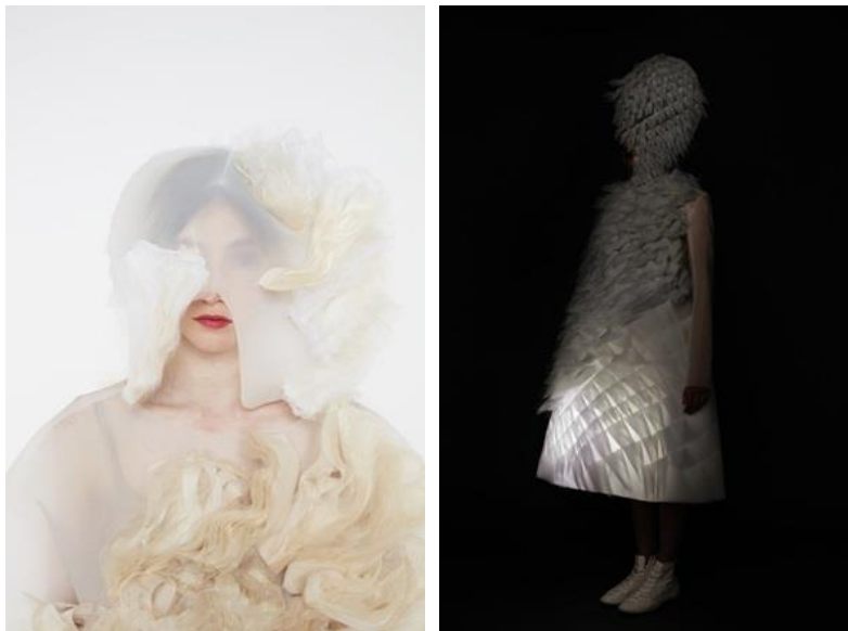
Fig.7 Neutralité : Can't and Won't. Ying

En la cumbre de esta fusión entre disciplinas arte-moda-tecnología no podemos dejar de mencionar la obra de Ying Gao, una diseñadora que busca convertir el vestuario en tecnología creativa y resaltar que aunque la vestimenta forme parte de nuestra cotidianidad muchas veces no atendemos a su contenido, a su mensaje como medio comunicativo, barrera que ella rompe gracias a prendas que se convierten en objetos lúdicos e interactivos.