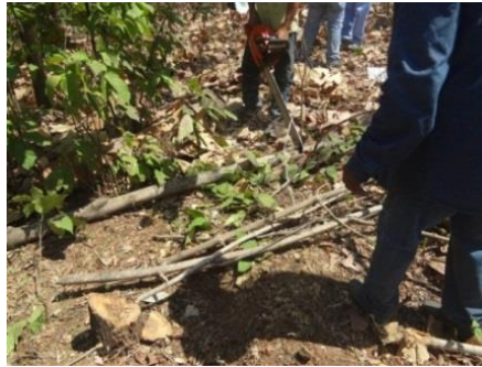
Figura 8: Colecta y pesada del fuste