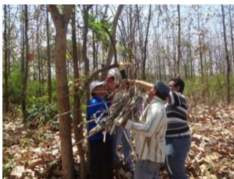
Figura 7: Colecta y pesada de ramas

Se cortaron las ramas existentes, y se recogieron aquellas que cayeron producto de la tala, siempre que estas pertenecieran al mismo árbol talado, cortándolas en secciones de 0,5 m a 1 m. De igual manera, se las colectó en una funda plástica, se las pesó y se extrajo una muestra de 1 kg, la cual debe ser representativa según la morfología de las ramas.