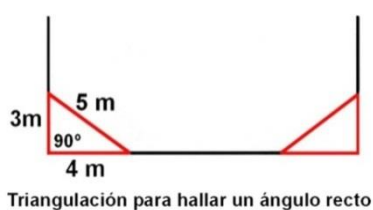
Triangulación para hallar un ángulo recto

El 12 de julio de 2015, mediante la metodología 3 – 4 – 5 de Pitágoras, se delimitó la parcela de muestreo de 500 m 2 que contiene las tecas producto del estudio a realizar, empleando 4 estacas y cinta métrica de 50 m de longitud. El gráfico a continuación resume la teoría geométrica que se aplica para establecer el cuadrante.