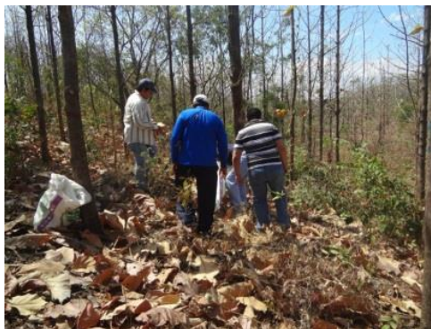
Figura 5: Colecta de Hojarasca

En un diámetro proporcional a la copa del árbol seleccionado, y cuyo centro es la ubicación del árbol, se recolectó la hojarasca disponible en la superficie del suelo. Esta fue recopilada en una funda plástica, para posteriormente ser pesada, de la cual se extrajo 1 kg de este material.