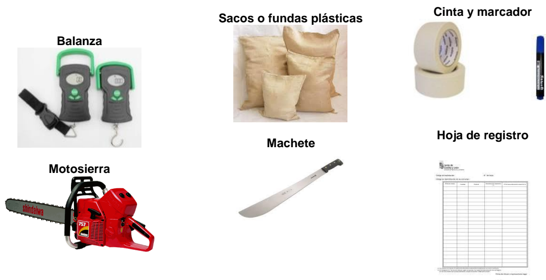
Figura 4: Equipos y materiales

Se efectuó el método directo “Destructivo”, seleccionando el árbol promedio in situ para su análisis, procurando que el mismo esté ubicado en la parte central de la parcela de muestreo (Schlegel, 2000). Una vez ubicado, con ayuda de los siguientes equipos y materiales, se realizó el siguiente protocolo: