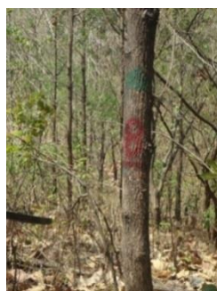
Figura 3: Árbol de teca medido y numerado

Una vez delimitada el área de 500 m 2 , se procedió a obtener los datos individuales de cada árbol de teca en la unidad de muestreo de manera general acorde a los criterios establecidos en la propuesta de la (FAO, 2004). Cada uno de los individuos de teca fue numerado y señalado con pintura roja; los datos de medición colectados fueron circunferencia a la altura del pecho (CAP) a 1,3 m de altura utilizando una cinta de 1,5 m, y cálculo de altura (H) de dos árboles, utilizando un hipsómetro, en base a lo cual se tomó un promedio de altura para los demás árboles.