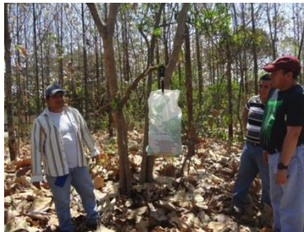
Figura 9: Colecta y pesada de la necromasa

Se recolectó la necromasa existente en 1 m 2 , en un área cercana al árbol talado.