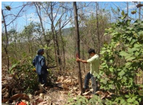
Figura 6: Tala del árbol promedio

Se procedió a talar el árbol, en su parte basal, con la ayuda de una motosierra y personal especializado en esta actividad, procurando que el árbol cayera en una zona donde no se vieran afectadas sus ramas y sus hojas.