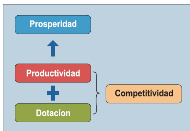
Figura 3. Índice de Competitividad Global