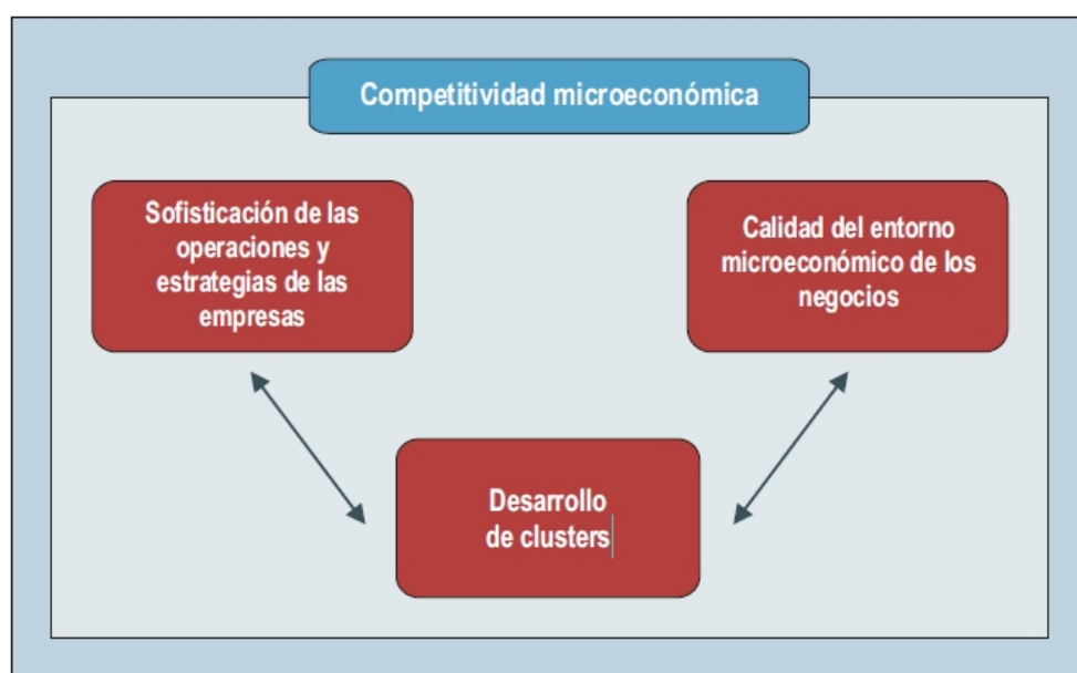
Figura 4. Factores de la Competitividad Microeconómica

Fuente: CEMPRO (2010). Estado del arte en medición de Competitividad. Metodologías de evaluación , 1(3), 1- 4.