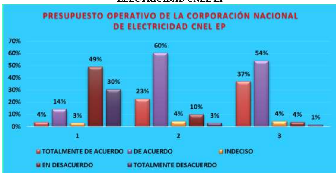
Grafico2. PRESUPUESTO OPERATIVO DE LA CORPORACIÓN NACIONAL DE ELECTRICIDAD CNEL EP

Elaborado por: Ing. F. Enrique Villegas - Ing. Dalva Icaza – Ing. Magdalena Valero