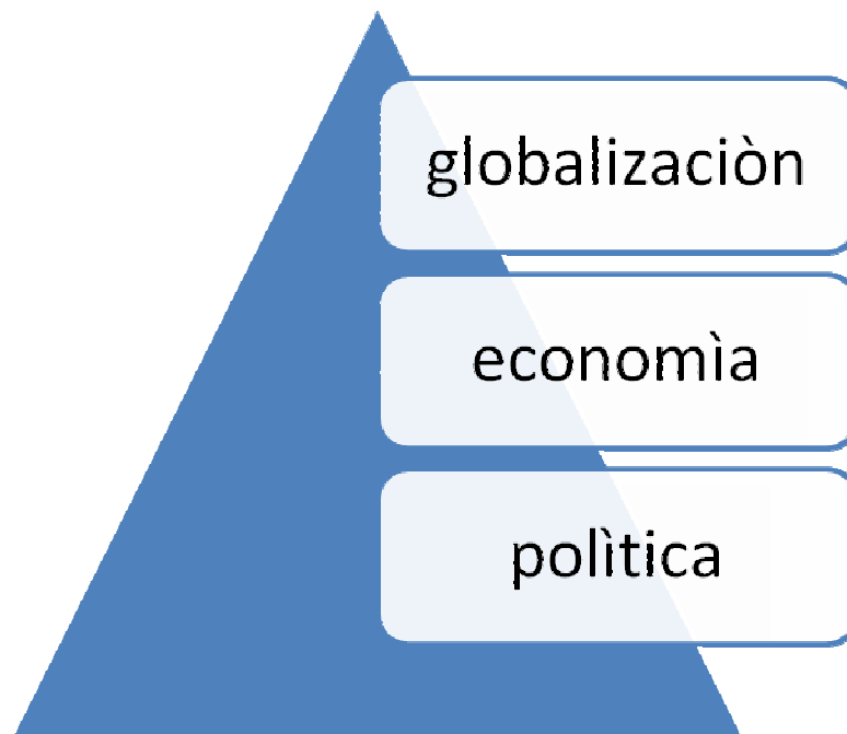
figura.1. Aspectos de la globalización (elaboración propia)

tecnologías alcanzan un grado muy alto de competitividad internacional y esto como empresa les da una mayor seguridad ante la competencia y a sus clientes de tener la satisfacción y certeza que sus productos están a nivel de cualquier producto y ante una empresa mundial. 4 Esta investigación se organiza de la siguiente manera: La sección 2 trata sobre Globalización, la 3 acerca de competitividad, la sección 4 analiza la innovación como factor importante para alcanzar la competitividad, la parte 5 proporciona la conclusión y propuestas.